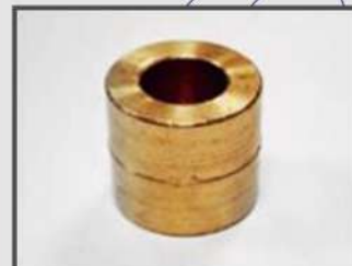
ВТУЛКА. ЗАКЛАДНОЙ ЭЛЕМЕНТ. АВТОПРОМ.