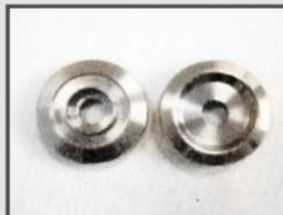
ШАЙБА. ЭЛЕКТРОТЕХНИЧЕСКАЯ ПРОМЫШЛЕННОСТЬ.