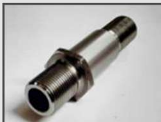
ШТУЦЕР РЕЗЬБОВОЙ. КРЕПЛЕНИЕ ФИЛЬТРА ОЧИСТКИ МАСЛА. АВТОПРОМ. АВТОМАТНАЯ СТАЛЬ 11SMNPB30