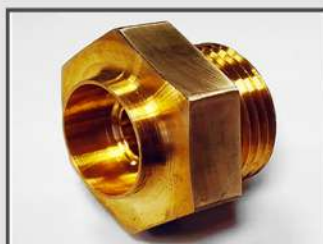
КОРПУС. ОБЩЕЕ МАШИНОСТРОЕНИЕ. МАТЕРИАЛ: CUZN39PB2F43 (ЛС59)