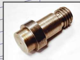
ЗАГЛУШКА РЕЗЬБОВАЯ. ЭЛЕМЕНТ СИСТЕМЫ ОХЛАЖДЕНИЯ. АВТОПРОМ. АВТОМАТНАЯ СТАЛЬ 11SMNPB30