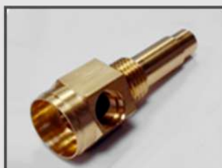
ЭЛЕМЕНТ СОЕДИНИТЕЛЬНЫЙ. КОРПУС ТЕРМОДАТЧИКА. АВТОПРОМ. CUZN39PB2R410 (ЛС59)