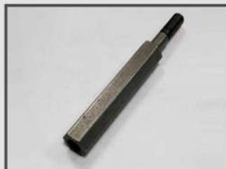
ШТУЦЕР РЕЗЬБОВОЙ. АВТОПРОМ. КРЕПЛЕНИЕ НАСОСА. НЕЛЕГИРОВАННАЯ ЦЕМЕНТИРОВАННАЯ СТАЛЬ S45+C. ТЕРМИЧЕСКАЯ ОБРАБОТКА, ЦИНКОВО-НИКЕЛЕВОЕ ПОКРЫТИЕ