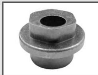
ВТУЛКА ЭКСЦЕНТРИКОВАЯ. ЭЛЕМЕНТ ДВИГАТЕЛЯ. АВТОПРОМ. АВТОМАТНАЯ СТАЛЬ 11SMNPB30 + ЦИНКОВАНИЕ