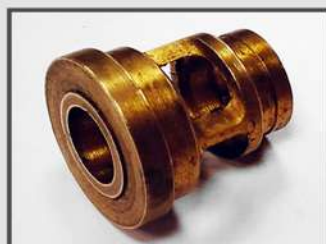
КОРПУС. ОБОРУДОВАНИЕ ДЛЯ ОБОГРЕВА И ВЕНТИЛЯЦИИ МАТЕРИАЛ: CUZN39PB2F43 (ЛС59)