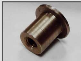
ВТУЛКА РЕЗЬБОВАЯ. АВТОПРОМ.