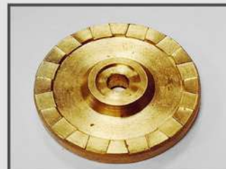
ШАЙБА. ОКОННЫЕ СИСТЕМЫ. ОБОРУДОВАНИЕ ДЛЯ ОБОГРЕВА И ВЕНТИЛЯЦИИ.