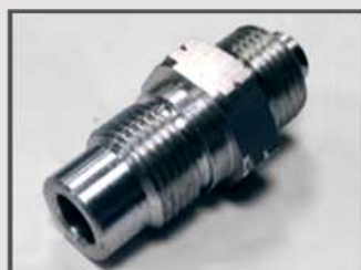
КОРПУС. АВТОПРОМ. ЭЛЕМЕНТ ТРАНСМИССИИ. МАТЕРИАЛ: AL-LEGIERUNG6026