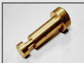
ШТИФТ. ЭЛЕМЕНТ БЕНЗОПРОВОДА. АВТОПРОМ.