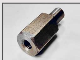
ВТУЛКА РЕЗЬБОВАЯ. АВТОПРОМ. ЭЛЕМЕНТ ДВИГАТЕЛЯ. АВТОМАТНАЯ СТАЛЬ 11SMNPB30