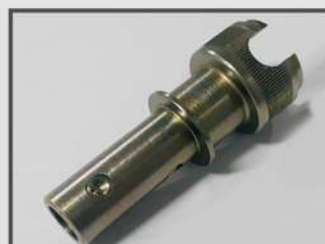
ЭЛЕМЕНТ СОЕДИНИТЕЛЬНЫЙ. АВТОПРОМ. ЦИНКОВАНИЕ, ЖЕЛТОЕ ХРОМАТИРОВАНИЕ. АВТОМАТНАЯ СТАЛЬ 11SMNPB30