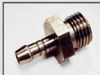
ФИКСАТОР. АВТОПРОМ. АВТОМАТНАЯ СТАЛЬ 11SMNPB30 ЦИНКОВО-НИКЕЛОВОЕ ПОКРЫТИЕ.