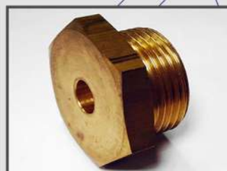
КОРПУС. ДЮЗА. ОБЩЕЕ МАШИНОСТРОЕНИЕ. МАТЕРИАЛ: CUZN39PB2F43 (ЛС59)