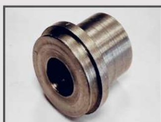
ВТУЛКА ОПОРНАЯ. АВТОПРОМ. ЭЛЕМЕНТ ДВИГАТЕЛЯ. АВТОМАТНАЯ СТАЛЬ 11SMNPB30+C