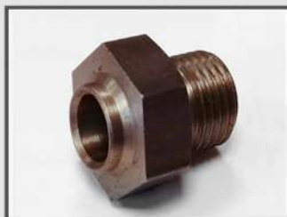
ЭЛЕМЕНТ СОЕДИНИТЕЛЬНЫЙ. ЭЛЕМЕНТ ДВИГАТЕЛЯ. АВТОПРОМ. АВТОМАТНАЯ СТАЛЬ 11SMNPB30