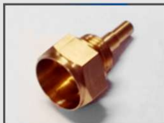
ЭЛЕМЕНТ СОЕДИНИТЕЛЬНЫЙ. КОРПУС ТЕРМОДАТЧИКА. АВТОПРОМ. CUZN39PB2R410 (ЛС59)