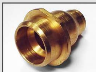
КОРПУС. ОБЩЕЕ МАШИНОСТРОЕНИЕ. МАТЕРИАЛ: CUZN39PB2F43 (ЛС59)