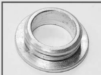
ВТУЛКА. ЗАКЛАДНОЙ ЭЛЕМЕНТ. АВТОПРОМ.