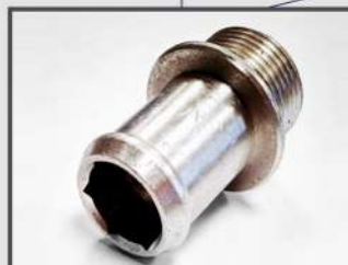
ШТУЦЕР РЕЗЬБОВОЙ. МАГНИТНЫЕ И ОКОННЫЕ СИСТЕМЫ. ТЕПЛОВОЕ ОБОРУДОВАНИЕ АЛЮМИНИЙ ALCUM9BF38