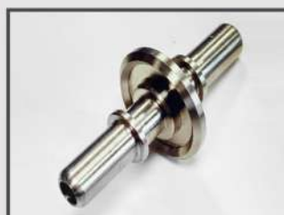
НИППЕЛЬ ФИЛЬТРА. ЭЛЕМЕНТ ВЕНТИЛЯЦИИ ТОПЛИВНОГО БАКА. АВТОПРОМ. КОРРОЗИОННО-СТОЙКАЯ СТАЛЬ X5CRNI 1810 (1.4301)