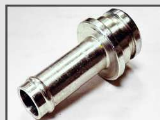
НИППЕЛЬ. ПАТРУБОК ТОПЛИВНОГО БАКА. АВТОПРОМ. КОРРОЗИОННО-СТОЙКАЯ СТАЛЬ 1.4307