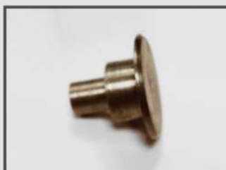
ЗАКЛЕПКА. МАГНИТНЫЕ И ОКОННЫЕ СИСТЕМЫ. ТЕПЛОВОЕ ОБОРУДОВАНИЕ. АВТОМАТНАЯ СТАЛЬ 11SMN30+C. ЦИНКОВАНИЕ.