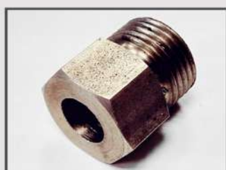
ВТУЛКА РЕЗЬБОВАЯ. АВТОПРОМ. ЭЛЕМЕНТ ДВИГАТЕЛЯ. АВТОМАТНАЯ СТАЛЬ 11SMNPB30