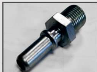
ЭЛЕМЕНТ СОЕДИНИТЕЛЬНЫЙ. ЭЛЕМЕНТ ДВИГАТЕЛЯ. ФОСФАТИРОВАНИЕ. АВТОМАТНАЯ СТАЛЬ 11SMNPB30