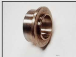
ВТУЛКА ШАРОВОЙ ОПОРЫ. ЭЛЕМЕНТ ТОПЛИВОПРОВОДА. АВТОПРОМ. КОРРОЗИОННО-СТОЙКАЯ СТАЛЬ 1.4305