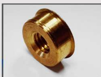
ВТУЛКА РЕЗЬБОВАЯ. АВТОПРОМ. CUZN39PB2F43 (ЛС59)